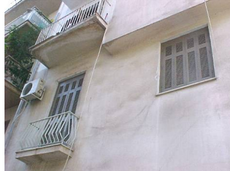
φωτ. 2 όψη από acáλυπτο

Το ακίνητο είναι στον πρώτο όροφο, είναι διαμπερές. Έχει ένα εξώστη στην όψη επί της οδού Αγορακρίτου (φωτ 1).