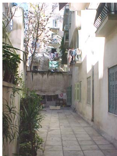
φωτ. 5 ακάλυπτος χώρος