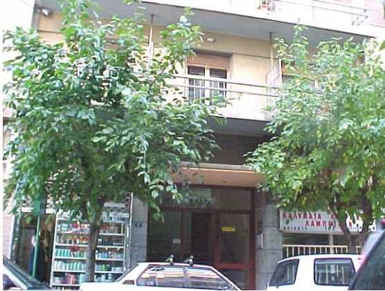
φωτ. 1 όψη από οδό Αγορακρίτου

Περιγραφή ακινήτου : Πολυώροφη πολυκατοικία, επί της οδού Αγορακρίτου. Η πολυκατοικία έχει έξι ορόφους. Στην πολυκατοικία βρίσκονται διαμερίσματα με χρήση κατοικίας στους ορόφους και δύο καταστήματα στο ισόγειο.