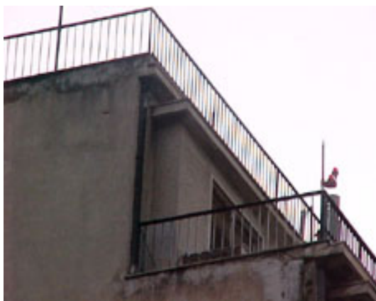
φωτ.3 : η βεράντα, από την οδό Κριεζώτου

Το διαμέρισμα (κληροδότημα του Ε.Μ.Π.), βρίσκεται στον τελευταίο όροφο και καταλαμβάνει όλο τον 7 ο όροφο. (φωτ.3,4). Έχει δύο ανεξάρτητες εισόδους. Το διαμέρισμα προέκυψε από τη συνένωση δύο διαφορετικών διαμερισμάτων.