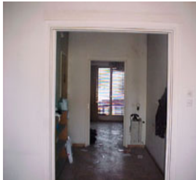
φωτ.6 : χωλ