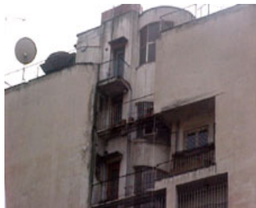
φωτ.4 : μεσοτοιχία της πολυκατοικίας και φωταγωγός

Οι χώροι του διαμερίσματος είναι οι εξής: χωλ, σαλόνι- τραπεζαρία-καθιστικό (σε συνέχεια), 2ο καθιστικό(στην πίσω όψη), κουζίνα, μικρό χωλ, wc, γραφείο, μικρό χωλ και wc, υπνοδωμάτιο και λουτρό. Οι τρεις μεγάλοι χώροι σαλόνι -τραπεζαρία-καθιστικό, βλέπουν σε βεράντα, πλάτους περίπου 3μ.(τελευταίο ρετιρέ). Οι φωτογραφίες που ακολουθούν είναι από την 10η.01.2002. Η θέα από την βεράντα είναι ιδιαίτερα αξιόλογη. Διακρίνονται ο λόφος του Λυκαβηττού και πολλά από τα