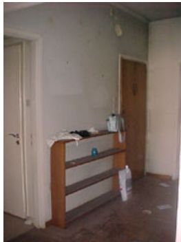
φωτ.5 : Χωλ, είσοδος

κτίρια της οδού Πανεπιστημίου. Επίσης από το παράθυρο του γραφείο φαίνεται η πλατεία Συντάγματος.