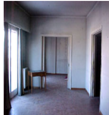
φωτ.7 : καθιστικό