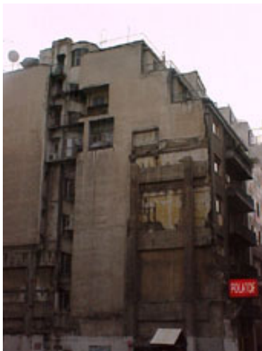
φωτ.1 : όψη από τον υπαίθριο χώρο στάθμευσης

Στο ισόγειο βρίσκεται εμπορικό καταστήματα και στους ορόφους διαμερίσματα με χρήση κατοικίας και γραφείων. Η είσοδος της πολυκατοικίας διατηρείται σε πολύ καλή κατάσταση και διαθέτει θυρωρείο.(φωτ.2)