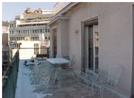
φωτ.9 : βεράντα