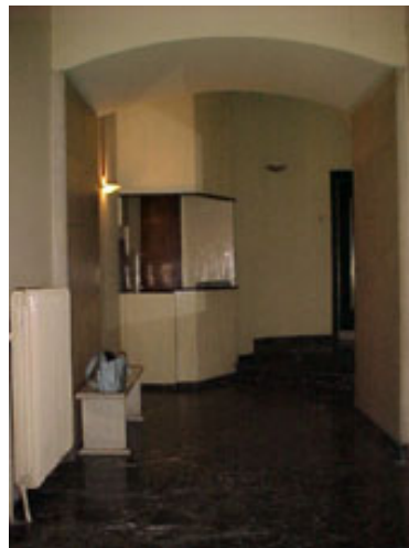
φωτ.2 : είσοδος πολυκατοικίας

Το διαμέρισμα (κληροδότημα του Ε.Μ.Π.), βρίσκεται στον τελευταίο όροφο και καταλαμβάνει όλο τον 7 ο όροφο. (φωτ.3,4). Έχει δύο ανεξάρτητες εισόδους. Το διαμέρισμα προέκυψε από τη συνένωση δύο διαφορετικών διαμερισμάτων.