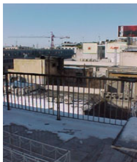
φωτ.8 : Θέα από τη βεράντα