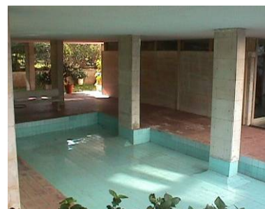
φωτ.7 : pilotis