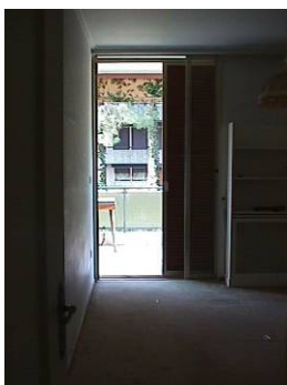
φωτ.5 : είσοδος

Οι χώροι του διαμερίσματος είναι οι εξής: καθιστικό, υπνοδωμάτιο, κουζίνα και λουτρό. Το καθιστικό και το υπνοδωμάτιο εκτονώνονται σε βεράντα, πλάτους περίπου 2μ..