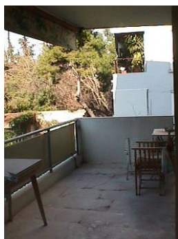
φωτ.6 : βεράντα