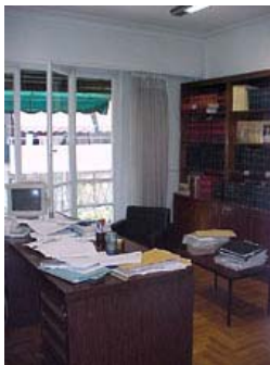
φωτ.10 : γραφείο δ'