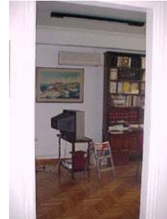
φωτ.9 : γραφείο β'