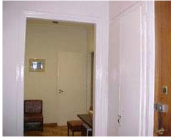
φωτ.7 : Χωλ, είσοδος

Οι χώροι του διαμερίσματος είναι οι εξής: δύο χωλ, τέσσερα δωμάτια (εκ των οποίων τα δύο χωρίζονται με συρόμενη πόρτα), κουζίνα, λουτρό wc, και αποθηκευτικός χώρος. Τα τρία δωμάτια από τα τέσσερα δωμάτια, βρίσκονται στην πλευρά επί της οδού Αναγνωστόπουλου και εκτονώνονται σε δύο μικρά μπαλκόνια. Η κουζίνα με το βοηθητικό χώρο βρίσκονται στην πίσω πλευρά. (σχ.1) Ακολουθεί φωτογραφική παρουσίαση των εσωτερικών χώρων.