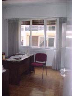
φωτ.8 : γραφείο γ'